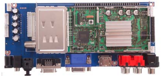
アナログ一体型小型 DTV モジュール デジタル受信回路面 サイズ:180(W)×86(D)×30mm(H)突起部を含む

今回、ベースとなるデジタル側のモジュールは、ハーフHD (High Definition) タイプの製品で、水平の解像度を半分(960ドットで内部処理)にすることでコストを低く抑えています。